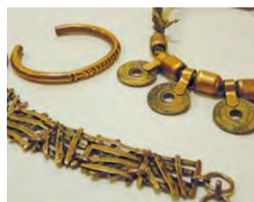
■ Handgearbeitete Kupfer-Schmuckkollektion aus Chile.

bige Aquarelle des Malers Claudio Capellini. Ihre Idee: wechselnde Künstler einzuladen und Kunst- und Fotoausstellungen in der Boutique zu organisieren sowie Arbeiten von Schülern aus Goldschmiedeschulen in Palma vorzustellen. Für den Winter erwartet die Chilenin aber erst mal eine Kollektion handgewebter Stoffe aus ihrer Heimat. Aus denen man sich sein Lieblingsstück dann selbst schneiden kann.